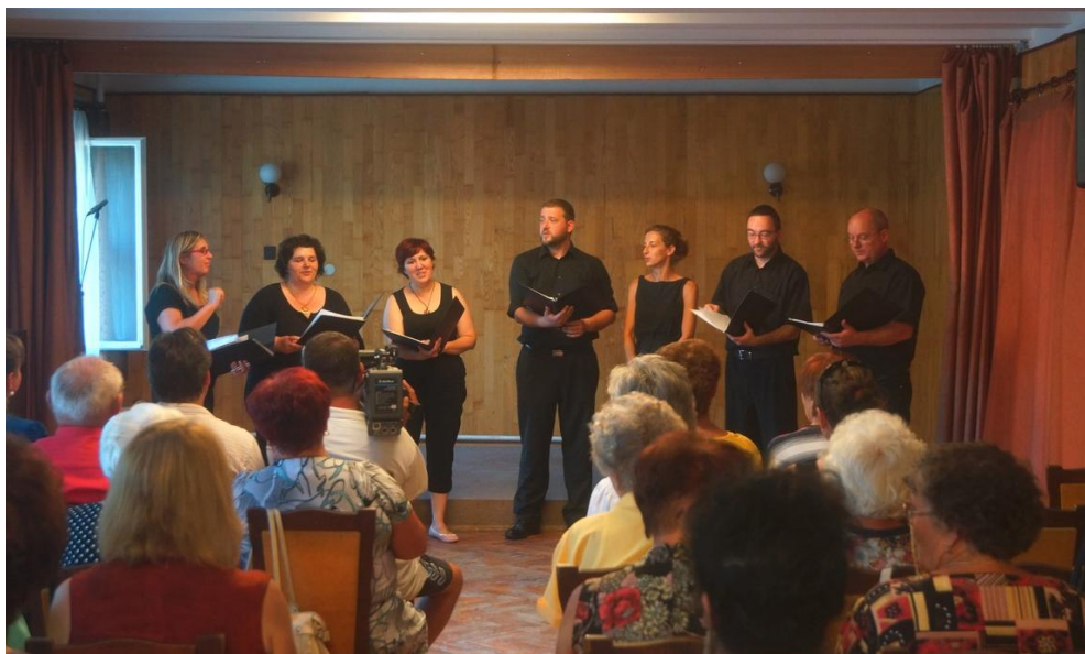
Calympa Énekegyüttes fellépése az avatóünnepségen

Marcali Városi Kulturális Központ MINŐSÍTETT KÖZMŰVELŐDÉSI INTÉZMÉNY