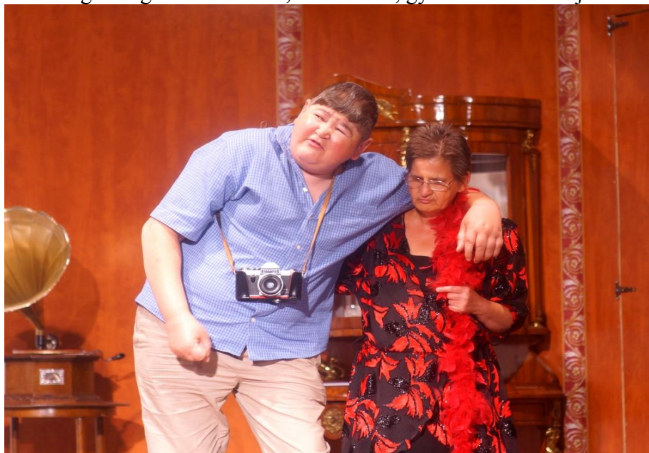
A kéthelyi Értelmi Fogyatékosok Otthonának lakói is szerepet kaptak a musicalben

A Kulturális Központ a TÁMOP 3.2.3/08/2-2009-0059-es számú pályázat fenntarthatóság keretében évek óta segíti az Imre Sándor Szeretetszínházat, mely az integráció jegyében fogyatékkal élő és egészséges felnőttekkel, fiatalokkal, gyermekekkel állítja színre darabjait.