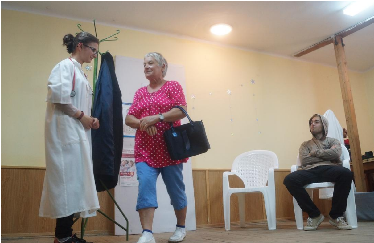
Rendelő – jelenet az orvosi váróban hagyott táskák, kabátok kifosztóiról