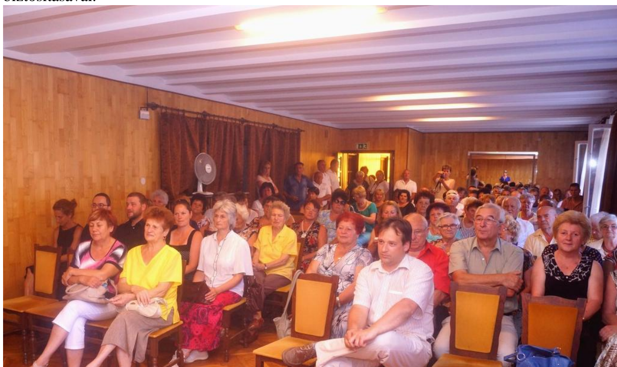
Az avatóünnepségen a Civil Szervezetek Házát használó egyesületek, klubok képviselői, tagjai vettek részt

2013-ban került a Kulturális Központ telephelyei közé a három emeletes Civil Szervezetek Háza a városközpontban. Az épület felújítását és akadálymentesítését Marcali Város Önkormányzata finanszírozta. Mint ahogyan a nevében is áll, civil szervezeteknek ad otthon, akár klubszoba, akár összejövetelek, vagy foglalkozások, próbák biztosításával.