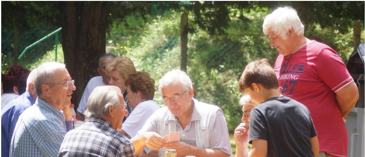
A férfiak ulti, a nők rómi csatát is vívtak a szellemi foglalkozások keretében