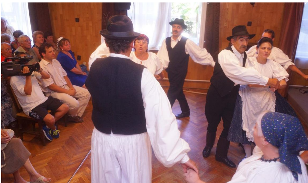
A Baglas Fundamentum Táncegyüttes is fellépett az avatóünnepségen

Az avatóünnepség részeként a Civil Szervezetek Házát használó egyesületek művészeti csoportjai léptek színpadra.