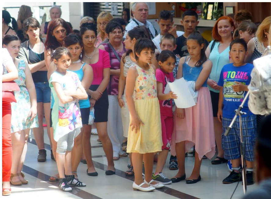
A program a Kulturális Korzóban folytatódott