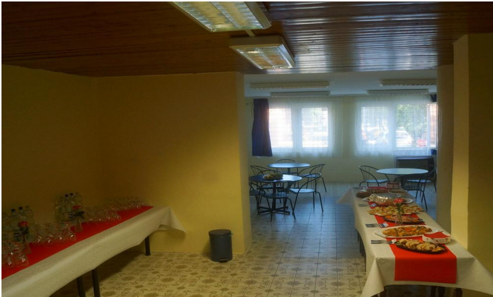
A földszinti rendezvényterem is kiváló helyszíne a próbáknak

Ez a terem kiválóan alkalmas vásárok és egyéb szervezett bemutató előadások, különböző tanfolyamok tartására.